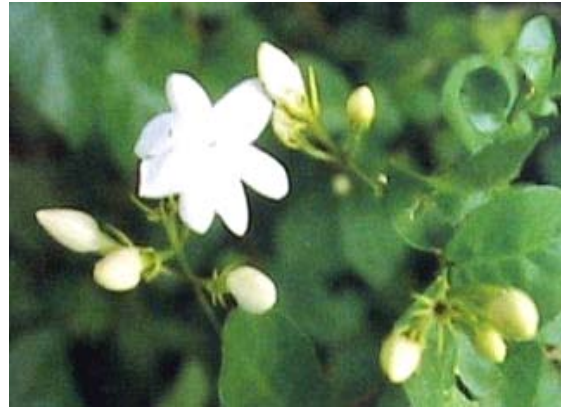
フィリピンの国花 サンパギータ

「証し」と言えば、何か固い感じがするので 先ず、花の話題から始めることにする。 “サンパギータ”という花の名前をお聞きに なったことがあるでしょうか？ この花はフィリピン(Philippines)の国花で 日本に例えると、桜に相当する。 可憐な白い小さな花で、清楚な香りがする。 花を摘んで糸を通しレイやブレスレッドにする。 英名ではArabian Jasmine と言う。